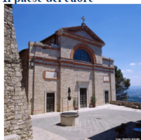
Una terrazza sull'Umbria