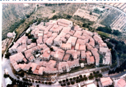
Il paese del cuore