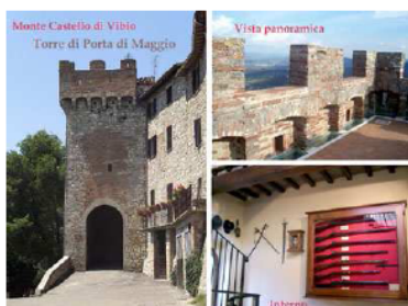
testimonianza di roccaforte medievale